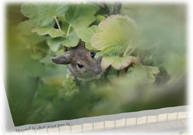
Quand le chat n'est pas là...

Merci aux participants pour cette belle exposition