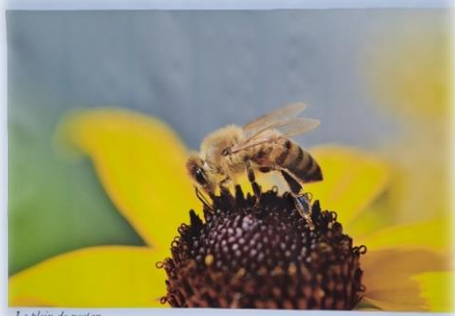
Le plein de nectar