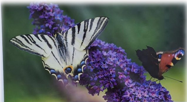
Flambé et Paon du Jour