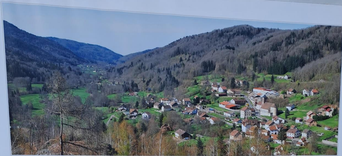
Vue depuis Le Breuchot