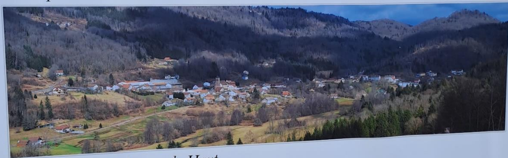
Vue depuis Le Rabosson du Haut