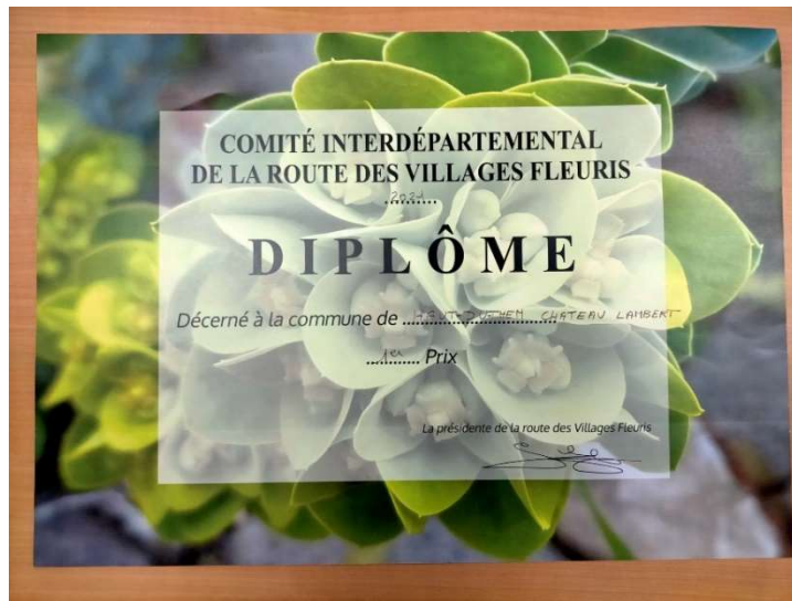
Prix remis par le jury de la Route des Villes et Villages Fleuris