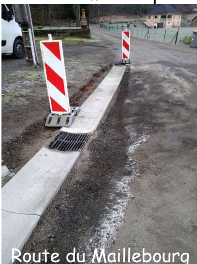
Route du Maillebourg

2021 s'en est allé, sur nos routes, les travaux prévus sont pratiquement terminés. Il reste la mise en place de cunettes impasse du Tacot pour récupérer