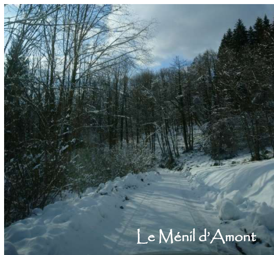
Le Ménil d'Amont