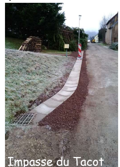
Impasse du Tacot

Les travaux 2022 devront être décidés au prochain budget, pour une mise en œuvre cet été !