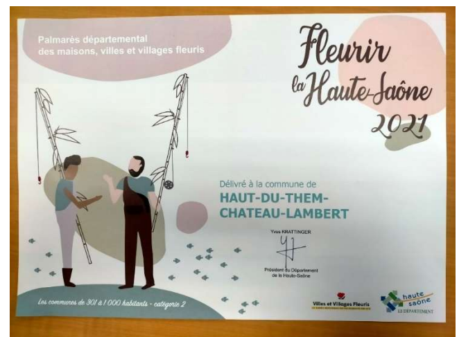
Prix remis par le Concours Départemental de la Route des Villes et Villages Fleuris