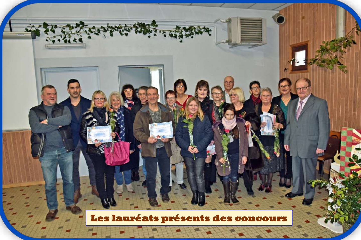
Les lauréats présents des concours

3, Rue de la Vierge - ☎ 03 84 20 40 84 - ☎ 03 84 63 86 80 - N° 060-01/2019 - courriel : mairieduhautduthem@wanadoo.fr - site Internet : http://hautduthem.cckvo.org Heures d'ouverture des bureaux : du lundi au samedi de 8 h 30 à 11 h 30